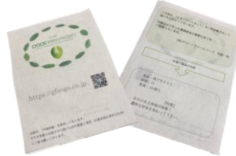
丹後和紙のギフトカード

※農場HACCPとは・・・畜産農場における飼養衛生管理向上の取組認証基準 JGAPとは・・・食の安全や環境保全に取り組む農場に与えられる認証