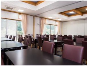
宿泊棟テラスと会議室