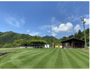
グラウンドゴルフ場

(株)丹波悠遊の森協会は、兵庫県丹波市柏原町でコテージやキャンプ場の運営をされており、2018年4月から福知山市大呂にある「京都大呂ガーデンテラス」の運営を開始されました。